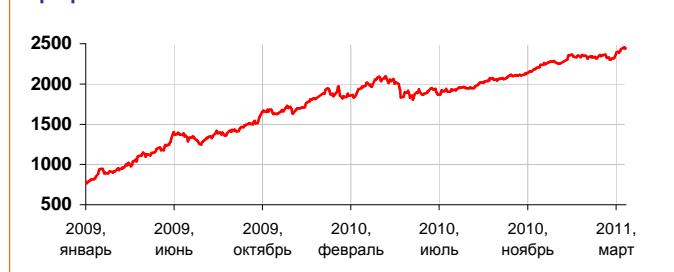
График изменения стоимости пая с 31.12.08 по 08.04.2011

Общество с ограниченной ответственностью «Управляющая компания «ПРОМСВЯЗЬ» осуществляет инвестиционную деятельность на основании следующих лицензий: лицензия на осуществление деятельности по управлению ИФ, ПИФ и НПИФ № 21-000-1-00096 от 20 декабря 2002 года, выдана ФСФР России, лицензия профессионального участника рынка ценных бумаг на осуществление деятельности по управлению ценными бумагами № 077-10104-001000 от 10 апреля 2007 года, выдана ФСФР России.