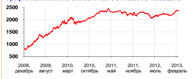
График изменения стоимости пая с 31.12.08 по 15.02.2013

Общество с ограниченной ответственностью «Управляющая компания ПРОМСВЯЗЬ» осуществляет инвестиционную деятельность на основании следующих лицензий: лицензия на осуществление деятельности по управлению ИФ, ПИФ и НПФ № 21-000-1-00096 от 20 декабря 2002 года, выдана ФСФР России, лицензия профессионального участника рынка ценных бумаг на осуществление деятельности по управлению ценными бумагами № 077-10104-001000 от 10 апреля 2007 года, выдана ФСФР России.