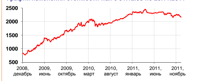
График изменения стоимости пая с 31.12.08 по 25.11.2011

Общество с ограниченной ответственностью «Управляющая компания ПРОМСВЯЗЬ» осуществляет инвестиционную деятельность на основании следующих лицензий: лицензия на осуществление деятельности по управлению ИФ, ПИФ и НПФ № 21-000-1-00096 от 20 декабря 2002 года, выдана ФСФР России, лицензия профессионального участника рынка ценных бумаг на осуществление деятельности по управлению ценными бумагами № 077-10104-001000 от 10 апреля 2007 года, выдана ФСФР России.