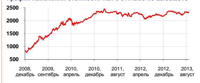
График изменения стоимости пая с 31.12.08 по 23.08.2013

Общество с ограниченной ответственностью «Управляющая компания ПРОМСВЯЗЬ» осуществляет инвестиционную деятельность на основании следующих лицензий: лицензия на осуществление деятельности по управлению ИФ, ПИФ и НПФ № 21-000-1-00096 от 20 декабря 2002 года, выдана ФСФР России, лицензия профессионального участника рынка ценных бумаг на осуществление деятельности по управлению ценными бумагами № 077-10104-001000 от 10 апреля 2007 года, выдана ФСФР России.