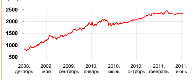
График изменения стоимости пая с 31.12.08 по 08.07.2011

Общество с ограниченной ответственностью «Управляющая компания ПРОМСВЯЗЬ» осуществляет инвестиционную деятельность на основании следующих лицензий: лицензия на осуществление деятельности по управлению ИФ, ПИФ и НПФ № 21-000-1-00096 от 20 декабря 2002 года, выдана ФСФР России, лицензия профессионального участника рынка ценных бумаг на осуществление деятельности по управлению ценными бумагами № 077-10104-001000 от 10 апреля 2007 года, выдана ФСФР России.