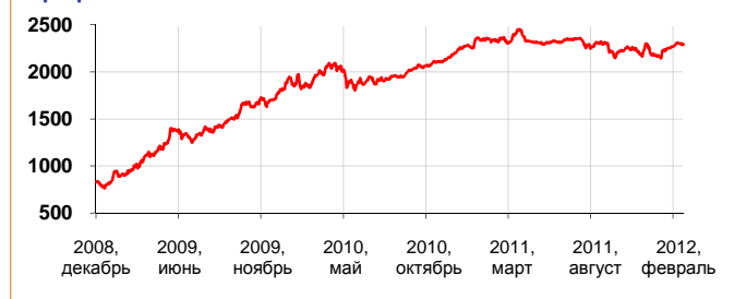
График изменения стоимости пая с 31.12.08 по 17.02.2012

Общество с ограниченной ответственностью «Управляющая компания ПРОМСВЯЗЬ» осуществляет инвестиционную деятельность на основании следующих лицензий: лицензия на осуществление деятельности по управлению ИФ, ПИФ и НПО № 21-000-1-00096 от 20 декабря 2002 года, выдана ФСФР России, лицензия профессионального участника рынка ценных бумаг на осуществление деятельности по управлению ценными бумагами № 077-10104-001000 от 10 апреля 2007 года, выдана ФСФР России.