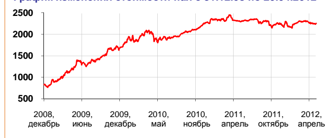
График изменения стоимости пая с 31.12.08 по 20.04.2012

Общество с ограниченной ответственностью «Управляющая компания ПРОМСВЯЗЬ» осуществляет инвестиционную деятельность на основании следующих лицензий: лицензия на осуществление деятельности по управлению ИФ, ПИФ и НПО № 21-000-1-00096 от 20 декабря 2002 года, выдана ФСФР России, лицензия профессионального участника рынка ценных бумаг на осуществление деятельности по управлению ценными бумагами № 077-10104-001000 от 10 апреля 2007 года, выдана ФСФР России.