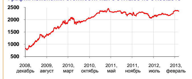
График изменения стоимости пая с 31.12.08 по 01.03.2013

Общество с ограниченной ответственностью «Управляющая компания ПРОМСВЯЗЬ» осуществляет инвестиционную деятельность на основании следующих лицензий: лицензия на осуществление деятельности по управлению ИФ, ПИФ и НПФ № 21-000-1-00096 от 20 декабря 2002 года, выдана ФСФР России, лицензия профессионального участника рынка ценных бумаг на осуществление деятельности по управлению ценными бумагами № 077-10104-001000 от 10 апреля 2007 года, выдана ФСФР России.