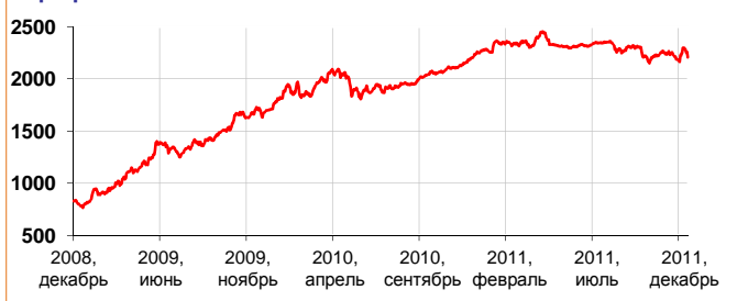
График изменения стоимости пая с 31.12.08 по 09.12.2011

Общество с ограниченной ответственностью «Управляющая компания ПРОМСВЯЗЬ» осуществляет инвестиционную деятельность на основании следующих лицензий: лицензия на осуществление деятельности по управлению ИФ, ПИФ и НПИФ № 21-000-1-00096 от 20 декабря 2002 года, выдана ФСФР России, лицензия профессионального участника рынка ценных бумаг на осуществление деятельности по управлению ценными бумагами № 077-10104-001000 от 10 апреля 2007 года, выдана ФСФР России.