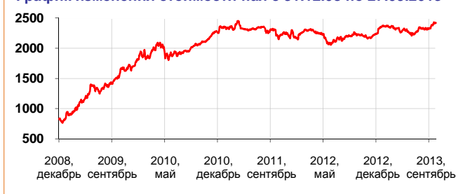
График изменения стоимости пая с 31.12.08 по 27.09.2013

Общество с ограниченной ответственностью «Управляющая компания ПРОМСВЯЗЬ» осуществляет инвестиционную деятельность на основании следующих лицензий: лицензия на осуществление деятельности по управлению ИФ, ГИФ и НГФ № 21-000-1-00096 от 20 декабря 2002 года, выдана ФСФР России, лицензия профессионального участника рынка ценных бумаг на осуществление деятельности по управлению ценными бумагами № 077-10104-001000 от 10 апреля 2007 года, выдана ФСФР России.