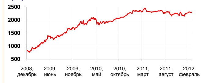
График изменения стоимости пая с 31.12.08 по 24.02.2012

Общество с ограниченной ответственностью «Управляющая компания ПРОМСВЯЗЬ» осуществляет инвестиционную деятельность на основании следующих лицензий: лицензия на осуществление деятельности по управлению ИФ, ПИФ и НПО № 21-000-1-00096 от 20 декабря 2002 года, выдана ФСФР России, лицензия профессионального участника рынка ценных бумаг на осуществление деятельности по управлению ценными бумагами № 077-10104-001000 от 10 апреля 2007 года, выдана ФСФР России. Стоимость инвестиционного пая может как увеличиваться, так и уменьшаться. Результаты инвестирования в прошлом не определяют доходы в будущем. Доходность инвестиций в паевые инвестиционные фонды не гарантируется государством. Перед приобретением инвестиционных паев необходимо внимательно ознакомиться с правилами доверительного управления паевым инвестиционным фондом. Правилами доверительного управления паевым инвестиционным фондом предусмотрена скидка с расчетной стоимости инвестиционных паев. Вниманию скидки уменьшит доходность инвестиций в инвестиционные паи паевого инвестиционного фонда. Данные материалы подготовлены аналитиками управляющей компании, отображают частное мнение и не являются обещанием в будущем эффективности деятельности (доходности финансовых вложений).