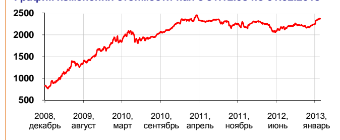
График изменения стоимости пая с 31.12.08 по 01.02.2013

Общество с ограниченной ответственностью «Управляющая компания ПРОМСВЯЗЬ» осуществляет инвестиционную деятельность на основании следующих лицензий: лицензия на осуществление деятельности по управлению ИФ, ПИФ и НПФ № 21-000-1-00096 от 20 декабря 2002 года, выдана ФСФР России, лицензия профессионального участника рынка ценных бумаг на осуществление деятельности по управлению ценными бумагами № 077-10104-001000 от 10 апреля 2007 года, выдана ФСФР России.