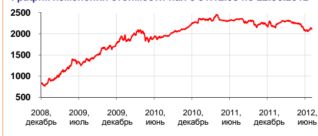
График изменения стоимости пая с 31.12.08 по 22.06.2012

Общество с ограниченной ответственностью «Управляющая компания ПРОМСВЯЗЬ» осуществляет инвестиционную деятельность на основании следующих лицензий: лицензия на осуществление деятельности по управлению ИФ, ГИФ и НПФ № 21-000-1-00096 от 20 декабря 2002 года, выдана ФСФР России, лицензия профессионального участника рынка ценных бумаг на осуществление деятельности по управлению ценными бумагами № 077-10104-001000 от 10 апреля 2007 года, выдана ФСФР России.