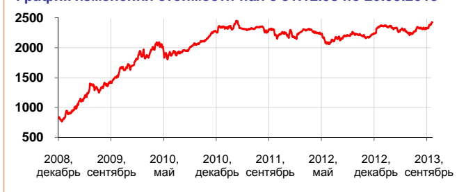
График изменения стоимости пая с 31.12.08 по 20.09.2013

Общество с ограниченной ответственностью «Управляющая компания ПРОМСВЯЗЬ» осуществляет инвестиционную деятельность на основании следующих лицензий: лицензия на осуществление деятельности по управлению ИФ, ПИФ и НПФ № 21-000-1-00096 от 20 декабря 2002 года, выдана ФСФР России, лицензия профессионального участника рынка ценных бумаг на осуществление деятельности по управлению ценными бумагами № 077-10104-001000 от 10 апреля 2007 года, выдана ФСФР России.