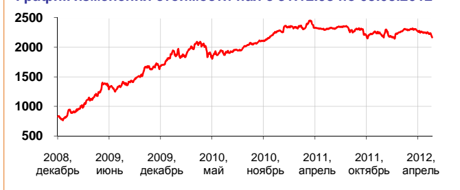
График изменения стоимости пая с 31.12.08 по 05.05.2012

Общество с ограниченной ответственностью «Управляющая компания ПРОМСВЯЗЬ» осуществляет инвестиционную деятельность на основании следующих лицензий: лицензия на осуществление деятельности по управлению ИФ, ПИФ и НПО № 21-000-1-00096 от 20 декабря 2002 года, выдана ФСФР России, лицензия профессионального участника рынка ценных бумаг на осуществление деятельности по управлению ценными бумагами № 077-10104-001000 от 10 апреля 2007 года, выдана ФСФР России. Стоимость инвестиционного пая может как увеличиваться, так и уменьшаться. Результаты инвестирования в прошлом не определяют доходы в будущем. Доходность инвестиций в паевой инвестиционный фонд не гарантируется государством. Перед приобретением инвестиционных паев необходимо внимательно ознакомиться с правилами доверительного управления паевым инвестиционным фондом. Правилами доверительного управления паевым инвестиционным фондом предусмотрена скидка с расчетной стоимости инвестиционных паев. Вниманию скидка уменьшает доходность инвестиций в инвестиционные паи паевого инвестиционного фонда. Данные материалы подготовлены аналитиками управляющей компании, отображают частное мнение и не являются обещанием в будущем эффективности деятельности (доходности финансовых вложений).