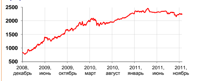
График изменения стоимости пая с 31.12.08 по 11.11.2011

Общество с ограниченной ответственностью «Управляющая компания ПРОМСВЯЗЬ» осуществляет инвестиционную деятельность на основании следующих лицензий: лицензия на осуществление деятельности по управлению ИФ, ПИФ и НПФ № 21-000-1-00096 от 20 декабря 2002 года, выдана ФСФР России, лицензия профессионального участника рынка ценных бумаг на осуществление деятельности по управлению ценными бумагами № 077-10104-001000 от 10 апреля 2007 года, выдана ФСФР России.