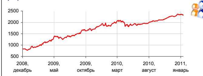
График изменения стоимости пая с 31.12.2008 по 11.02.2011

Общество с ограниченной ответственностью «Управляющая компания ПРОМСВЯЗЬ» осуществляет инвестиционную деятельность на основании следующих лицензий: лицензия на осуществление деятельности по управлению ИФ, ПИФ и НПФ № 21-000-1-00096 от 20 декабря 2002 года, выдана ФСФР России, лицензия профессионального участника рынка ценных бумаг на осуществление деятельности по управлению ценными бумагами № 077-10104-001000 от 10 апреля 2007 года, выдана ФСФР России.