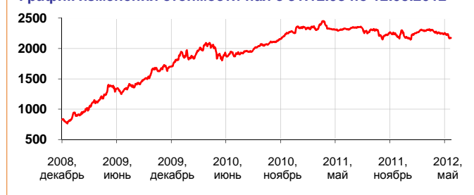
График изменения стоимости пая с 31.12.08 по 12.05.2012

Общество с ограниченной ответственностью «Управляющая компания ПРОМСВЯЗЬ» осуществляет инвестиционную деятельность на основании следующих лицензий: лицензия на осуществление деятельности по управлению ИФ, ПИФ и НПО № 21-000-1-00096 от 20 декабря 2002 года, выдана ФСФР России, лицензия профессионального участника рынка ценных бумаг на осуществление деятельности по управлению ценными бумагами № 077-10104-001000 от 10 апреля 2007 года, выдана ФСФР России.