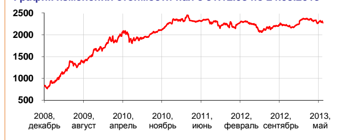
График изменения стоимости пая с 31.12.08 по 24.05.2013

Общество с ограниченной ответственностью «Управляющая компания ПРОМСВЯЗЬ» осуществляет инвестиционную деятельность на основании следующих лицензий: лицензия на осуществление деятельности по управлению ИФ, ГИФ и НГФ № 21-000-1-00096 от 20 декабря 2002 года, выдана ФСФР России, лицензия профессионального участника рынка ценных бумаг на осуществление деятельности по управлению ценными бумагами № 077-10104-001000 от 10 апреля 2007 года, выдана ФСФР России.