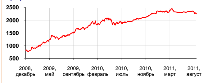
График изменения стоимости пая с 31.12.08 по 19.08.2011

Общество с ограниченной ответственностью «Управляющая компания ПРОМСВЯЗЬ» осуществляет инвестиционную деятельность на основании следующих лицензий: лицензия на осуществление деятельности по управлению ИФ, ПИФ и НПФ № 21-000-1-00096 от 20 декабря 2002 года, выдана ФСФР России, лицензия профессионального участника рынка ценных бумаг на осуществление деятельности по управлению ценными бумагами № 077-10104-001000 от 10 апреля 2007 года, выдана ФСФР России.