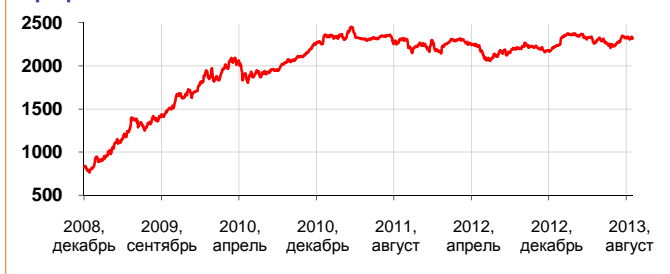
График изменения стоимости пая с 31.12.08 по 16.08.2013

Общество с ограниченной ответственностью «Управляющая компания ПРОМСВЯЗЬ» осуществляет инвестиционную деятельность на основании следующих лицензий: лицензия на осуществление деятельности по управлению ИФ, ПИФ и НПФ № 21-000-1-00096 от 20 декабря 2002 года, выдана ФСФР России, лицензия профессионального участника рынка ценных бумаг на осуществление деятельности по управлению ценными бумагами № 077-10104-001000 от 10 апреля 2007 года, выдана ФСФР России.