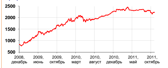
График изменения стоимости пая с 31.12.08 по 21.10.2011

Общество с ограниченной ответственностью «Управляющая компания ПРОМСВЯЗЬ» осуществляет инвестиционную деятельность на основании следующих лицензий: лицензия на осуществление деятельности по управлению ИФ, ПИФ и НПФ № 21-000-1-00096 от 20 декабря 2002 года, выдана ФСФР России, лицензия профессионального участника рынка ценных бумаг на осуществление деятельности по управлению ценными бумагами № 077-10104-001000 от 10 апреля 2007 года, выдана ФСФР России.