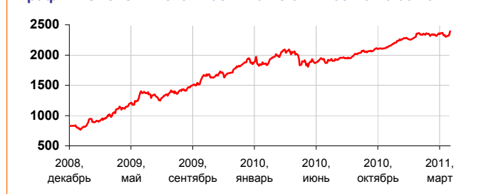
График изменения стоимости пая с 31.12.08 по 25.03.2011

Общество с ограниченной ответственностью «Управляющая компания ПРОМСВЯЗЬ» осуществляет инвестиционную деятельность на основании следующих лицензий: лицензия на осуществление деятельности по управлению ИФ, ПИФ и НПФ № 21-000-1-00098 от 20 декабря 2002 года, выдана ФОФР России, лицензия профессионального участника рынка ценных бумаг на осуществление деятельности по управлению ценными бумагами № 077-10104-001000 от 10 апреля 2007 года, выдана ФОФР России.