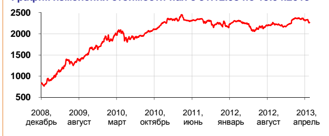
График изменения стоимости пая с 31.12.08 по 19.04.2013

Общество с ограниченной ответственностью «Управляющая компания ПРОМСВЯЗЬ» осуществляет инвестиционную деятельность на основании следующих лицензий: лицензия на осуществление деятельности по управлению ИФ, ГИФ и НГФ № 21-000-1-00096 от 20 декабря 2002 года, выдана ФСФР России, лицензия профессионального участника рынка ценных бумаг на осуществление деятельности по управлению ценными бумагами № 077-10104-001000 от 10 апреля 2007 года, выдана ФСФР России.