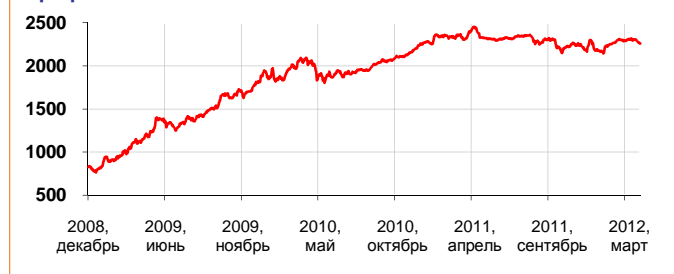
График изменения стоимости пая с 31.12.08 по 23.03.2012

Общество с ограниченной ответственностью «Управляющая компания ПРОМСВЯЗЬ» осуществляет инвестиционную деятельность на основании следующих лицензий: лицензия на осуществление деятельности по управлению ИФ, ПИФ и НПО № 21-000-1-00096 от 20 декабря 2002 года, выдана ФСФР России, лицензия профессионального участника рынка ценных бумаг на осуществление деятельности по управлению ценными бумагами № 077-10104-001000 от 10 апреля 2007 года, выдана ФСФР России.