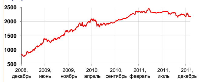
График изменения стоимости пая с 31.12.08 по 23.12.2011

Общество с ограниченной ответственностью «Управляющая компания ПРОМСВЯЗЬ» осуществляет инвестиционную деятельность на основании следующих лицензий: лицензия на осуществление деятельности по управлению ИФ, ПИФ и НПО № 21-000-1-00096 от 20 декабря 2002 года, выдана ФСФР России, лицензия профессионального участника рынка ценных бумаг на осуществление деятельности по управлению ценными бумагами № 077-10104-001000 от 10 апреля 2007 года, выдана ФСФР России.