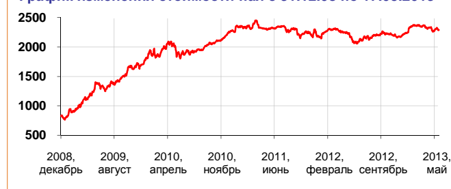
График изменения стоимости пая с 31.12.08 по 17.05.2013

Общество с ограниченной ответственностью «Управляющая компания ПРОМСВЯЗЬ» осуществляет инвестиционную деятельность на основании следующих лицензий: лицензия на осуществление деятельности по управлению ИФ, ГИФ и НГФ № 21-000-1-00096 от 20 декабря 2002 года, выдана ФСФР России, лицензия профессионального участника рынка ценных бумаг на осуществление деятельности по управлению ценными бумагами № 077-10104-001000 от 10 апреля 2007 года, выдана ФСФР России.