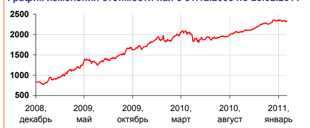
График изменения стоимости пая с 31.12.2008 по 25.02.2011

Общество с ограниченной ответственностью «Управляющая компания ПРОМСВЯЗЬ» осуществляет инвестиционную деятельность на основании следующих лицензий: лицензия на осуществление деятельности по управлению ИФ, ПИФ и НПИ № 21-000-1-00096 от 20 декабря 2002 года, выдана ФСФР России, лицензия профессионального участника рынка ценных бумаг на осуществление деятельности по управлению ценными бумагами № 077-10104-001000 от 10 апреля 2007 года, выдана ФСФР России. Стоимость инвестиционного пая может как увеличиваться, так и уменьшаться. Результаты инвестирования в прошлом не определяют доходы в будущем. Доходность инвестиций в паевой инвестиционный фонд не гарантируется государством. Перед приобретением инвестиционных паев необходимо внимательно ознакомиться с правилами доверительного управления паевым инвестиционным фондом. Правилами доверительного управления паевым инвестиционным фондом предусмотрена скидка с расчетной стоимости инвестиционных паев. Вниманию скидка уменьшит доходность инвестиций в инвестиционные паи паевого инвестиционного фонда. Данные материалы подготовлены аналитиками управляющей компании, отображают частное мнение и не являются обещанием в будущем эффективности деятельности (доходности финансовых вложений).