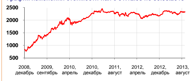
График изменения стоимости пая с 31.12.08 по 30.08.2013

Общество с ограниченной ответственностью «Управляющая компания ПРОМСВЯЗЬ» осуществляет инвестиционную деятельность на основании следующих лицензий: лицензия на осуществление деятельности по управлению ИФ, ГИФ и НПФ № 21-000-1-00096 от 20 декабря 2002 года, выдана ФСФР России, лицензия профессионального участника рынка ценных бумаг на осуществление деятельности по управлению ценными бумагами № 077-10104-001000 от 10 апреля 2007 года, выдана ФСФР России.