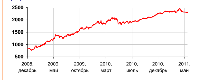
График изменения стоимости пая с 31.12.08 по 20.05.2011

Общество с ограниченной ответственностью «Управляющая компания ПРОМСВЯЗЬ» осуществляет инвестиционную деятельность на основании следующих лицензий: лицензия на осуществление деятельности по управлению ИФ, ПФ и НПФ № 21-000-1-00096 от 20 декабря 2002 года, выдана ФОФР России, лицензия профессионального участника рынка ценных бумаг на осуществление деятельности по управлению ценными бумагами № 077-10104-001000 от 10 апреля 2007 года, выдана ФОФР России.