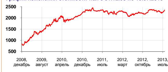
График изменения стоимости пая с 31.12.08 по 19.07.2013

Общество с ограниченной ответственностью «Управляющая компания ПРОМСВЯЗЬ» осуществляет инвестиционную деятельность на основании следующих лицензий: лицензия на осуществление деятельности по управлению ИФ, ГИФ и НГФ № 21-000-1-00096 от 20 декабря 2002 года, выдана ФСФР России, лицензия профессионального участника рынка ценных бумаг на осуществление деятельности по управлению ценными бумагами № 077-10104-001000 от 10 апреля 2007 года, выдана ФСФР России.