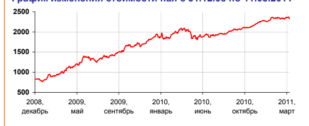
График изменения стоимости пая с 31.12.08 по 11.03.2011

Общество с ограниченной ответственностью «Управляющая компания ПРОМСВЯЗЬ» осуществляет инвестиционную деятельность на основании следующих лицензий: лицензия на осуществление деятельности по управлению ИФ, ПИФ и НПИ № 21-000-1-00096 от 20 декабря 2002 года, выдана ФСФР России, лицензия профессионального участника рынка ценных бумаг на осуществление деятельности по управлению ценными бумагами № 077-10104-001000 от 10 апреля 2007 года, выдана ФСФР России.