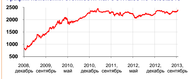
График изменения стоимости пая с 31.12.08 по 13.09.2013

Общество с ограниченной ответственностью «Управляющая компания ПРОМСВЯЗЬ» осуществляет инвестиционную деятельность на основании следующих лицензий: лицензия на осуществление деятельности по управлению ИФ, ПИФ и НПФ № 21-000-1-00096 от 20 декабря 2002 года, выдана ФСФР России, лицензия профессионального участника рынка ценных бумаг на осуществление деятельности по управлению ценными бумагами № 077-10104-001000 от 10 апреля 2007 года, выдана ФСФР России.