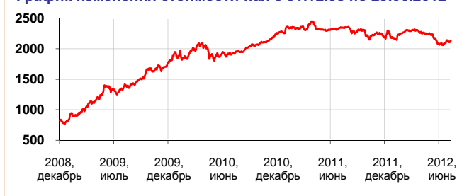
График изменения стоимости пая с 31.12.08 по 29.06.2012

Общество с ограниченной ответственностью «Управляющая компания ПРОМСВЯЗЬ» осуществляет инвестиционную деятельность на основании следующих лицензий: лицензия на осуществление деятельности по управлению ИФ, ГИФ и НПФ № 21-000-1-00096 от 20 декабря 2002 года, выдана ФСФР России, лицензия профессионального участника рынка ценных бумаг на осуществление деятельности по управлению ценными бумагами № 077-10104-001000 от 10 апреля 2007 года, выдана ФСФР России.