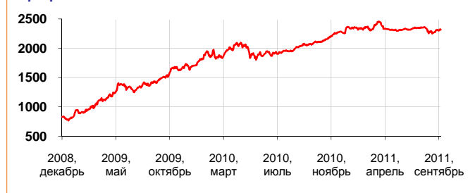
График изменения стоимости пая с 31.12.08 по 09.09.2011

Общество с ограниченной ответственностью «Управляющая компания ПРОМСВЯЗЬ» осуществляет инвестиционную деятельность на основании следующих лицензий: лицензия на осуществление деятельности по управлению ИФ, ПИФ и НПФ № 21-000-1-00096 от 20 декабря 2002 года, выдана ФСФР России, лицензия профессионального участника рынка ценных бумаг на осуществление деятельности по управлению ценными бумагами № 077-10104-001000 от 10 апреля 2007 года, выдана ФСФР России.