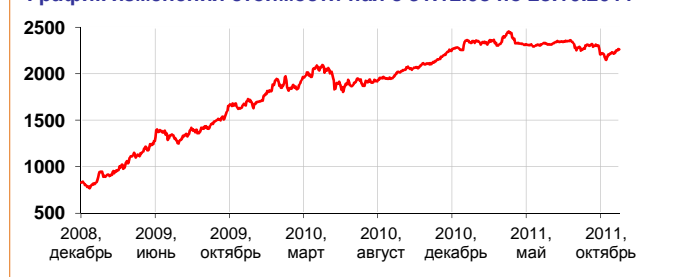
График изменения стоимости пая с 31.12.08 по 28.10.2011

Общество с ограниченной ответственностью «Управляющая компания ПРОМСВЯЗЬ» осуществляет инвестиционную деятельность на основании следующих лицензий: лицензия на осуществление деятельности по управлению ИФ, ПИФ и НПФ № 21-000-1-00096 от 20 декабря 2002 года, выдана ФСФР России, лицензия профессионального участника рынка ценных бумаг на осуществление деятельности по управлению ценными бумагами № 077-10104-001000 от 10 апреля 2007 года, выдана ФСФР России.