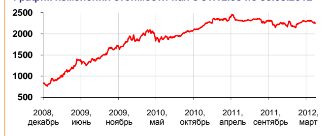
График изменения стоимости пая с 31.12.08 по 30.03.2012

Общество с ограниченной ответственностью «Управляющая компания ПРОМСВЯЗЬ» осуществляет инвестиционную деятельность на основании следующих лицензий: лицензия на осуществление деятельности по управлению ИФ, ПИФ и НПИФ № 21-000-1-00036 от 20 декабря 2002 года, выдана ФСФР России, лицензия профессионального участника рынка ценных бумаг на осуществление деятельности по управлению ценными бумагами № 077-10104-001000 от 10 апреля 2007 года, выдана ФСФР России.