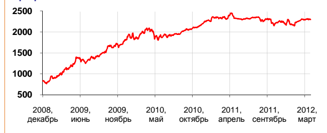
График изменения стоимости пая с 31.12.08 по 16.03.2012

Общество с ограниченной ответственностью «Управляющая компания ПРОМСВЯЗЬ» осуществляет инвестиционную деятельность на основании следующих лицензий: лицензия на осуществление деятельности по управлению ИФ, ПИФ и НПИ № 21-000-1-00096 от 20 декабря 2002 года, выдана ФСФР России, лицензия профессионального участника рынка ценных бумаг на осуществление деятельности по управлению ценными бумагами № 077-10104-001000 от 10 апреля 2007 года, выдана ФСФР России.