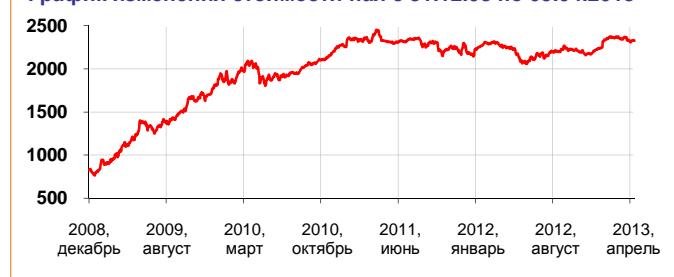
График изменения стоимости пая с 31.12.08 по 05.04.2013

Общество с ограниченной ответственностью «Управляющая компания ПРОМСВЯЗЬ» осуществляет инвестиционную деятельность на основании следующих лицензий: лицензия на осуществление деятельности по управлению ИФ, ПИФ и НПИ № 21-000-1-00096 от 20 декабря 2002 года, выдана ФСФР России, лицензия профессионального участника рынка ценных бумаг на осуществление деятельности по управлению ценными бумагами № 077-10104-001000 от 10 апреля 2007 года, выдана ФСФР России.