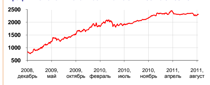
График изменения стоимости пая с 31.12.08 по 02.09.2011

Общество с ограниченной ответственностью «Управляющая компания ПРОМСВЯЗЬ» осуществляет инвестиционную деятельность на основании следующих лицензий: лицензия на осуществление деятельности по управлению ИФ, ПИФ и НПФ № 21-000-1-00096 от 20 декабря 2002 года, выдана ФСФР России, лицензия профессионального участника рынка ценных бумаг на осуществление деятельности по управлению ценными бумагами № 077-10104-001000 от 10 апреля 2007 года, выдана ФСФР России.