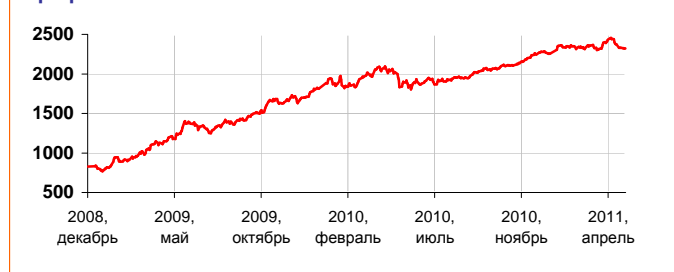
График изменения стоимости пая с 31.12.08 по 29.04.2011

Общество с ограниченной ответственностью «Управляющая компания ПРОМСВЯЗЬ» осуществляет инвестиционную деятельность на основании следующих лицензий: лицензия на осуществление деятельности по управлению ИФ, ПИФ и НПФ № 21-000-1-00096 от 20 декабря 2002 года, выдана ФОФР России, лицензия профессионального участника рынка ценных бумаг на осуществление деятельности по управлению ценными бумагами № 077-10104-001000 от 10 апреля 2007 года, выдана ФОФР России.