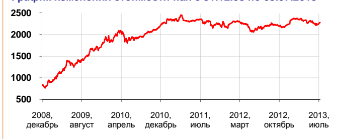
График изменения стоимости пая с 31.12.08 по 05.07.2013

Общество с ограниченной ответственностью «Управляющая компания ПРОМСВЯЗЬ» осуществляет инвестиционную деятельность на основании следующих лицензий: лицензия на осуществление деятельности по управлению ИФ, ГИФ и НГФ № 21-000-1-00096 от 20 декабря 2002 года, выдана ФСФР России, лицензия профессионального участника рынка ценных бумаг на осуществление деятельности по управлению ценными бумагами № 077-10104-001000 от 10 апреля 2007 года, выдана ФСФР России.