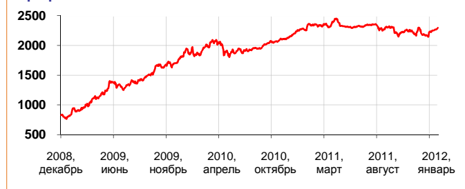
График изменения стоимости пая с 31.12.08 по 03.02.2012

Общество с ограниченной ответственностью «Управляющая компания ПРОМСВЯЗЬ» осуществляет инвестиционную деятельность на основании следующих лицензий: лицензия на осуществление деятельности по управлению ИФ, ПИФ и НПО № 21-000-1-00096 от 20 декабря 2002 года, выдана ФСФР России, лицензия профессионального участника рынка ценных бумаг на осуществление деятельности по управлению ценными бумагами № 077-10104-001000 от 10 апреля 2007 года, выдана ФСФР России.