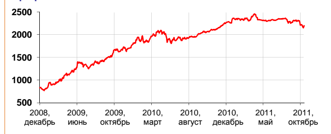
График изменения стоимости пая с 31.12.08 по 07.10.2011

Общество с ограниченной ответственностью «Управляющая компания ПРОМСВЯЗЬ» осуществляет инвестиционную деятельность на основании следующих лицензий: лицензия на осуществление деятельности по управлению ИФ, ПИФ и НПФ № 21-000-1-00096 от 20 декабря 2002 года, выдана ФСФР России, лицензия профессионального участника рынка ценных бумаг на осуществление деятельности по управлению ценными бумагами № 077-10104-001000 от 10 апреля 2007 года, выдана ФСФР России.