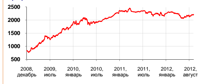
График изменения стоимости пая с 31.12.08 по 24.08.2012

Общество с ограниченной ответственностью «Управляющая компания ПРОМСВЯЗЬ» осуществляет инвестиционную деятельность на основании следующих лицензий: лицензия на осуществление деятельности по управлению ИФ, ГИФ и НПФ № 21-000-1-00096 от 20 декабря 2002 года, выдана ФСФР России, лицензия профессионального участника рынка ценных бумаг на осуществление деятельности по управлению ценными бумагами № 077-10104-001000 от 10 апреля 2007 года, выдана ФСФР России.