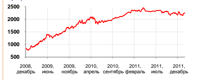
График изменения стоимости пая с 31.12.08 по 20.01.2012

Общество с ограниченной ответственностью «Управляющая компания ПРОМСВЯЗЬ» осуществляет инвестиционную деятельность на основании следующих лицензий: лицензия на осуществление деятельности по управлению ИФ, ПИФ и НПО № 21-000-1-00096 от 20 декабря 2002 года, выдана ФСФР России; лицензия профессионального участника рынка ценных бумаг на осуществление деятельности по управлению ценными бумагами № 077-10104-001000 от 10 апреля 2007 года, выдана ФСФР России.